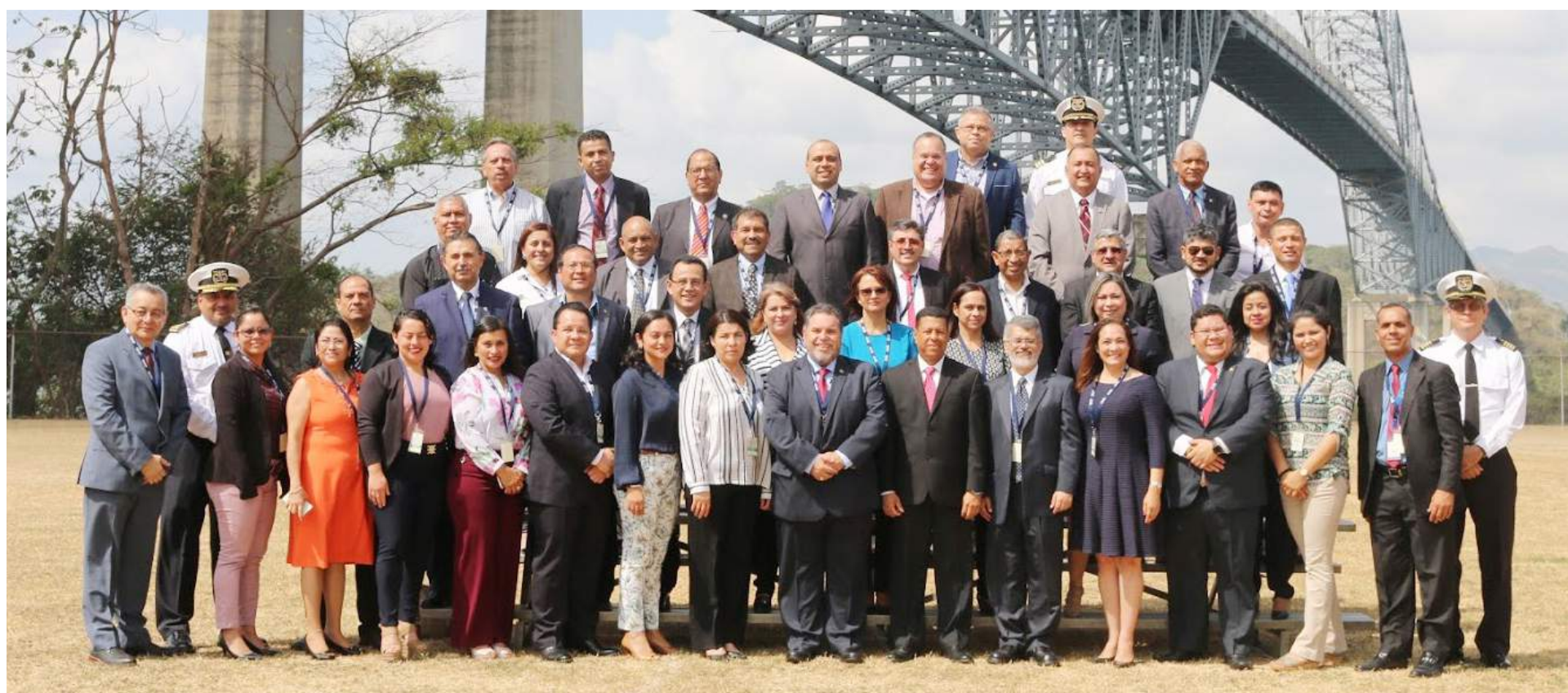
Representantes de universidades de centroamérica en la 50 Reunión del Sistema Regional Centroamericano y del Caribe de Investigación y Posgrado SIRCIP.