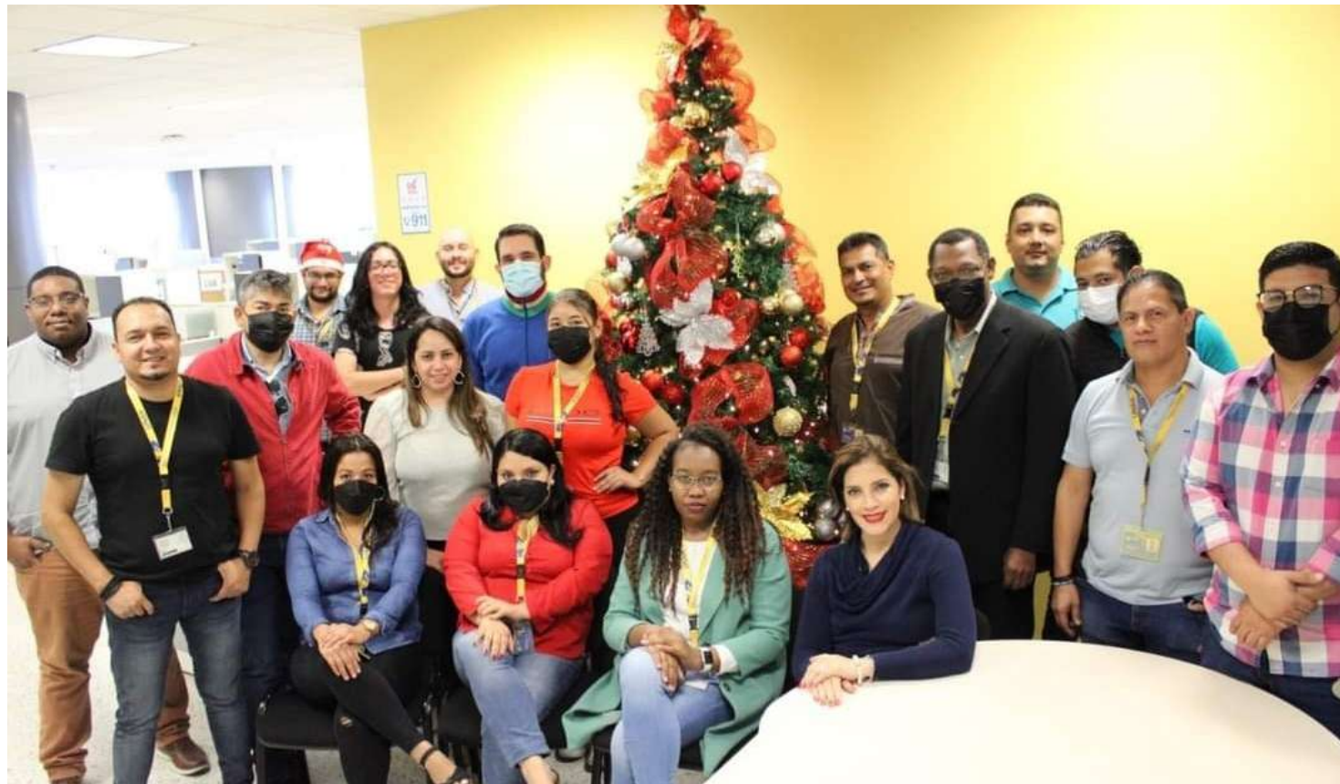
Equipo de trabajo de la DICIHT.

1. JM. PRIMERA IDEA: Empecemos por una idea base. Una vez que le anunciaron, que estaba nombrado, que iba a ser el Director de Investigación de la UNAH; una vez que estaba seguro de ello,