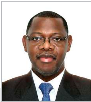
Por: Santiago J. Ruíz, Ph. D.

Director de la Dirección de Investigación Científica, Humanística y Tecnológica