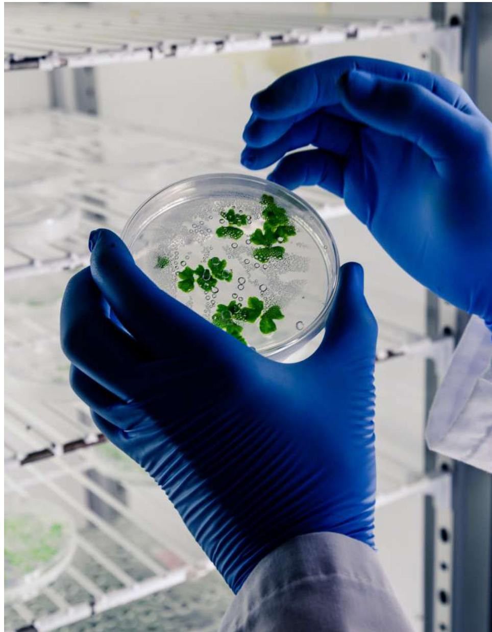
La polio, o parálisis infantil, fue otra de las seis enfermedades prevenibles seleccionadas por la OMS para combatir mediante inmunización infantil universal.

La polio, o parálisis infantil, fue otra de las seis enfermedades prevenibles seleccionadas por la OMS para combatir mediante inmunización infantil universal. Antes de la introducción de la primera vacuna contra la polio, la enfermedad era una de las más temidas enfermedades infantiles porque podía producir parálisis permanente o la muerte. En los ochenta, cuando la enfermedad aun infectaba unos 500,000 niños por año, la OMS convocó a la erradicación global de la polio para el año 2002. Aunque estas metas demostraron ser demasiado optimistas, la campaña mundial condujo a una drástica reducción de la incidencia de