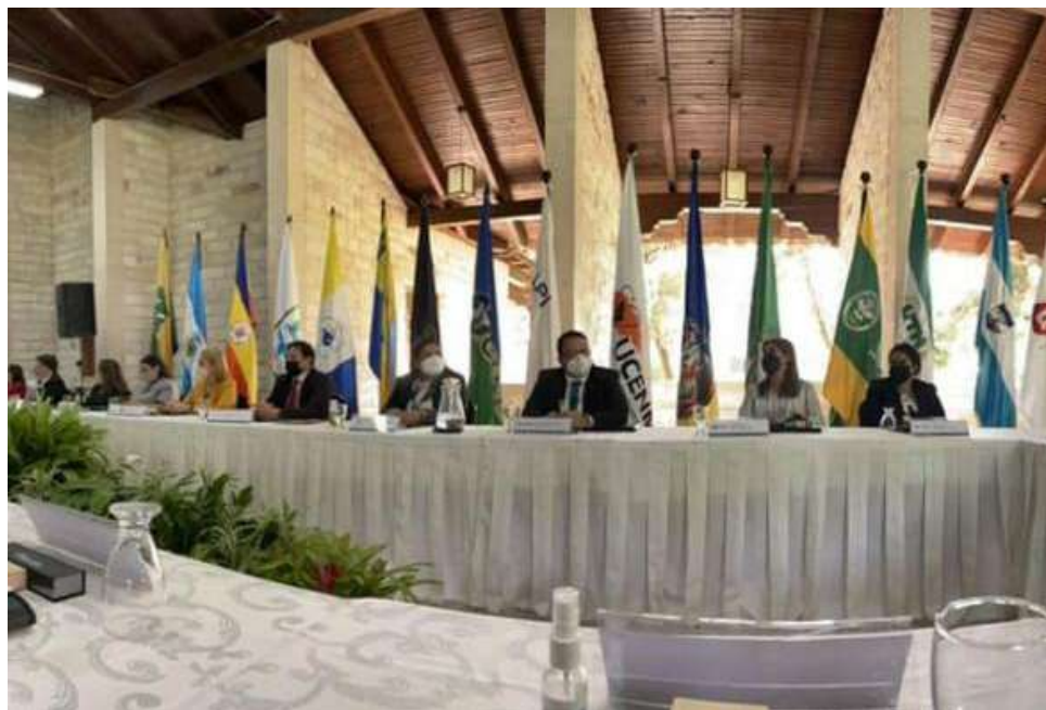
Algunos de los Rectores y representantes de las 21 universidades hondureñas firmaron la Declaratoria de Rectores: Transversalización del Eje Temático de Ambiente con énfasis en Cambio Climático y Gestión Integral del Riesgo de Desastres, con el apoyo de COSUDE y CICA